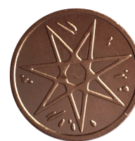
Étoile de cuivre

En plus de ces monnaies officielles, on peut encore voir circuler d'autres monnaies plus exotiques, comme par exemple la main d'or, en vigueur avant la conquête, qui vaut peu ou prou un demi dragon d'or ou des monnaies diverses venues d'Essos, ou chaque cité frappe sa propre monnaie.